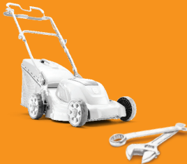
औजारहरू, बगैचाका लागि प्रयोग गरिने उपकरणहरू