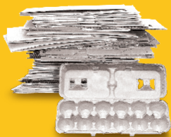
च्याप्टो पारेका कार्डबोर्ड र अण्डाका बट्टाहरू (खाम भन्दा स्यानो होइन)

तपाईंको बोटलहरू र भाँडाहरू (कन्टेनरहरू) पखाल्नुहोला, तिनीहरू खाली छन् भनेर निश्चित गर्नु होला, र बिकोर्हरू रातो बिनमा राख्नुहोला।