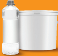
अनावश्यक, प्रयोग नगरिएका वा पुराना रंग रोगनहरू, झोलहरू