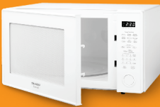
उपकरणहरू उदाहरणका लागि माइक्रोवेभहरू, फ्रिजहरू, ड्रायरहरू, लुगा धुने मेसिनहरू