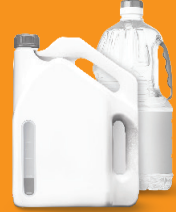
अनावश्यक, प्रयोग नगरिएका वा पुरानो तेल उदाहरणका लागि गाडीको तेल, खाना पकाउने तेल