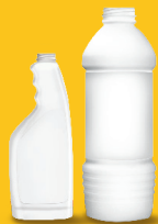
सफा गर्न, माइन प्रयोग गरिने झोलहरू राख्ने खाली भाँडाहरू (कन्टेनरहरू) (बिकोर्हरू रातो बिनमा)