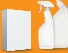
अनावश्यक, प्रयोग नगरिएका वा पुरानो घरेलु तरल रसायनहरू, सफा गर्ने पदार्थहरू, सुख्खा रसायनहरू