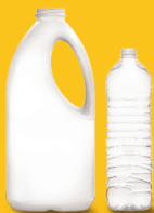
प्लास्टिकका बोटलहरू दहीको सानो भाँडा भन्दा सानो भने होइन (बिकोर्हरू रातो बिनमा)