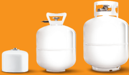
क्याम्पिङ्गमा प्रयोग गरिने सानो ग्याँसका भाँडाहरू, हिलीएम ग्याँसका बोत्तलहरू, ग्याँसका बोत्तलहरू