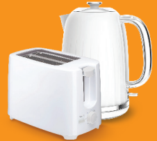
साना उपकरणहरू उदाहरणका लागि पानी उमाल्ने भाँडाहरू (केटलहरू), पानी राख्ने भाँडाहरू (जगहरू), भाँडाकुडाहरू, प्यानहरू