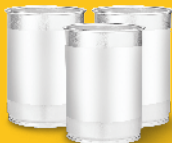
धातुका बट्टाहरू (बिकोर्हरू रातो बिनमा)