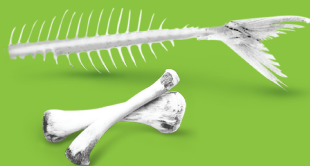
吃剩的肉, 骨頭, 貝類海鮮, 魚