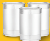
金屬罐或錫罐 (蓋子都丟入紅桶)