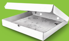
包炸魚薯條的紙, 裝披薩的盒子, 廚房紙巾, 碎紙屑, 餐巾紙