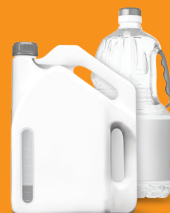
不要用的，沒用過的 或是存放已久的油， 例如機油，食用油