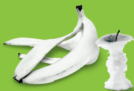
水果, 蔬菜, 食物殘渣