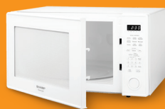
電器如微波爐，電冰箱， 烘乾機或吹風機，洗衣機