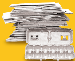
平展的硬紙板 和裝雞蛋的托盤 (不小於一個標準信封)