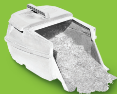
園林廢棄物 (不包括亞麻樹和劍葉 巨蕉樹的葉子)