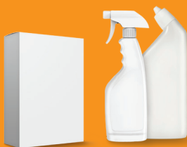
不要用的，沒用過的 或是存放已久的家用化學液體， 清潔劑，乾燥的化學藥物。