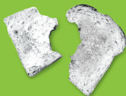
麵包, 麵條, 烘焙物