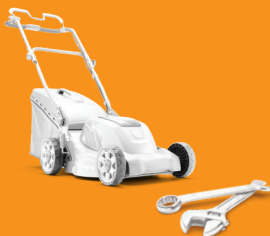
工具，清理花園的用具