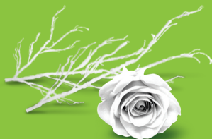
剪下的花朵, 枝葉, 修剪的樹枝