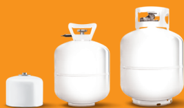
露營用瓦斯罐，氮氣瓶， 瓦斯瓶