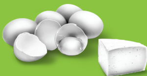
起司, 蛋, 奶油